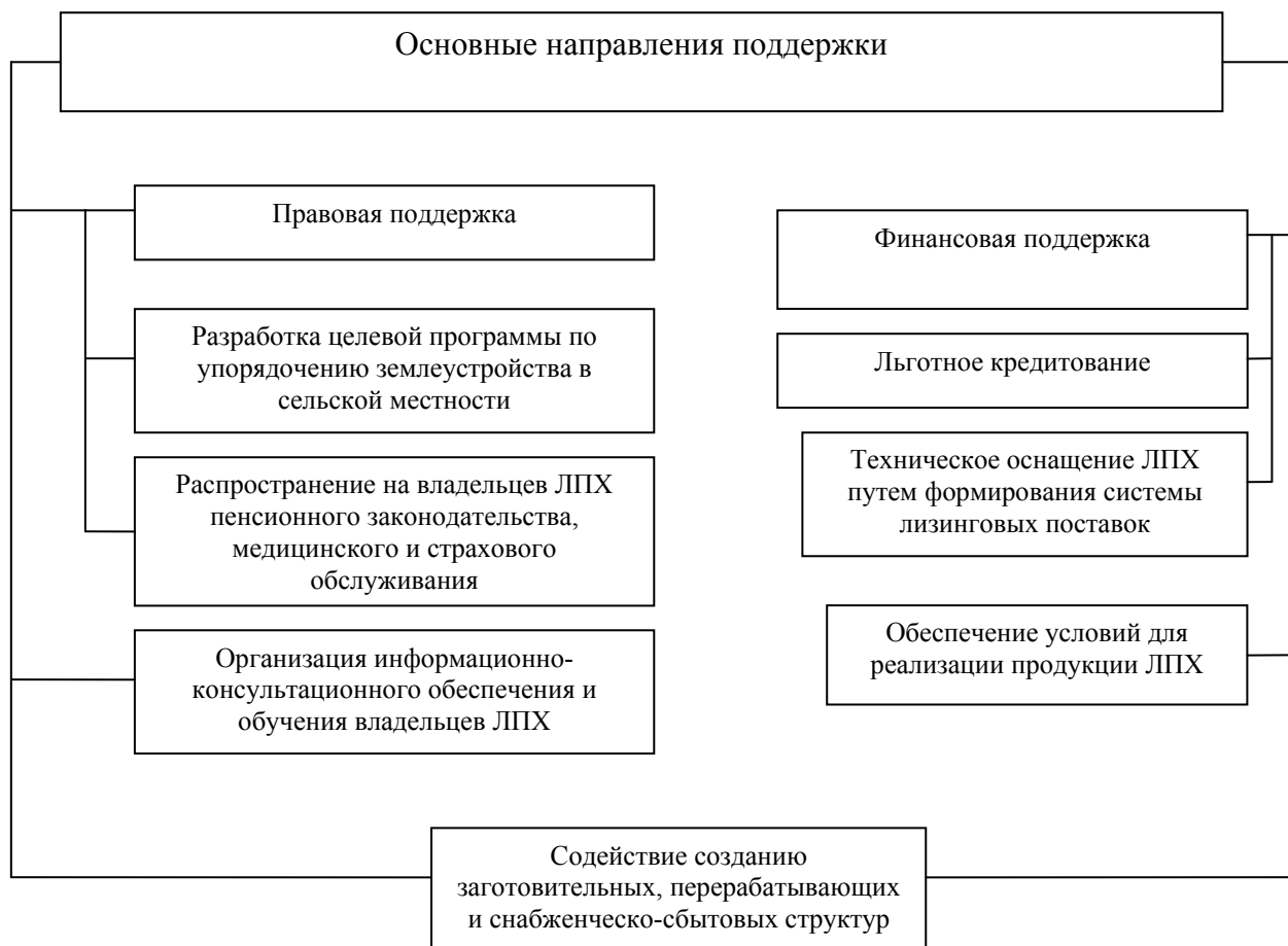
Рис. 1. Направления государственной поддержки ЛПХ населения Республики Бурятия на региональном уровне