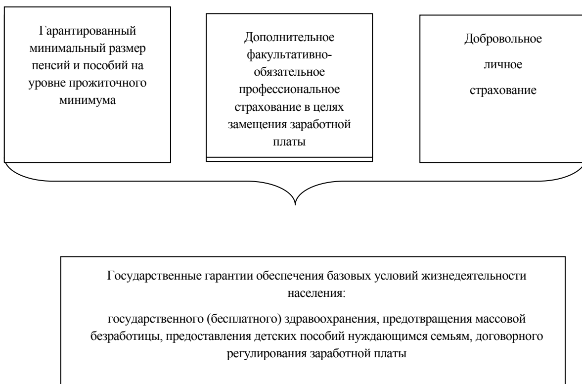
Рис. 2. Модель социальной защиты Бевериджа